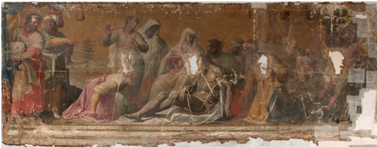
Prima del restauro: -Compianto sul Cristo deposto dalla Croce di di Giovanni Balducci

Le due tele col Cristo che cade sotto la Croce e il Compianto sul Cristo deposto furono rimosse da Gaetano Baccani negli anni quaranta dell'Ottocento e, a lungo tenute arrotolate, al momento del ritiro per farle sottoporre a restauro, si presentarono gravemente danneggiate dall'umidità e dalle precarie condizioni dell'ambiente, con vaste perdite della superficie dipinta dovute ai vari spostamenti e alla fragile natura della materia: una tempera a caseina di vacca su tela.