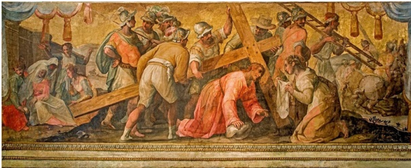
Cristo cade sotto la Croce di di Giovanni Balducci

La loro collocazione nel Museo dell'Opera del Duomo, che ha conosciuto un pressoché completo riordinamento e riallestimento, è stata opportunamente individuata nella zona detta "Galleria dei Modelli", che ospita le proposte per la facciata del duomo realizzate in legno da vari autori dalla fine del Cinquecento, dopo la data del 1587, anno in cui fu demolita la parte della facciata arnofiana.